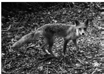
↑自動撮影カメラで捉えたホンドキツネ

ごみ処理施設建設に伴い、建設地の環境への影響を調査した中で、ホンドキツネの営巣が確認され、生息環境を保全するために代替営巣地の整備等を行ってきました。令和6年度も引き続き、自動撮影カメラを設置して、確認場所や頻度等を観測して、ホンドキツネの行動範囲の把握などの調査を継続します。さらに、専門家へ調査状況の報告・意見のヒアリングを行いながら、必要に応じて追加の環境保全措置を実施します。