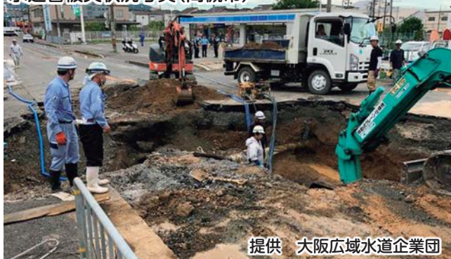
水道管被災状況写真(高槻市)

大規模な地震などの災害発生時には、市内全域で同時多発的に様々な被害が発生し、水道施設にも被害が及ぶことから、みなさまの生活に欠かすことが出来ない水道水の供給も困難となり、断水してしまう場合があります。