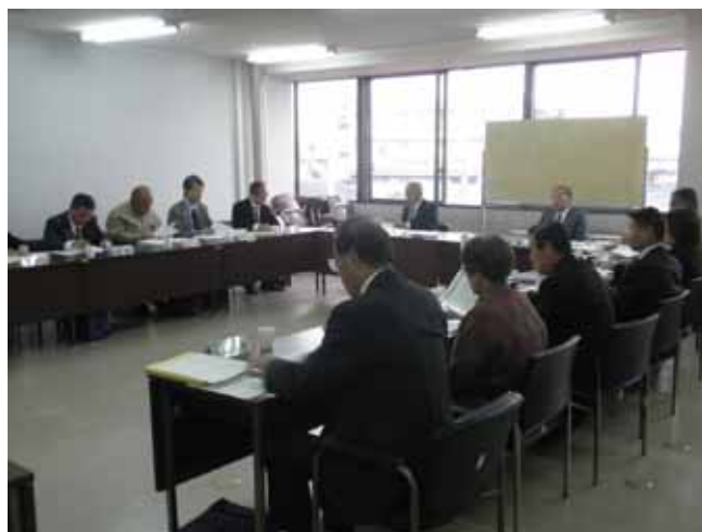
江南市まちづくり会議の様子

江南市戦略計画達成状況報告書の作成 （分野別会議 11 回、全体会議 1 回開催）