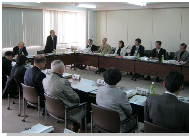
江南市まちづくり会議の様子