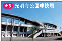
★6 光明寺公園球技場