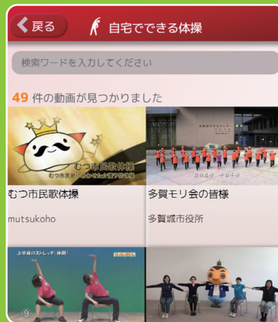
自宅で出来る体操動画 画面イメージ

適切な運動や活動を行うための フローチャートや運動・ 活動メニューを閲覧できます。