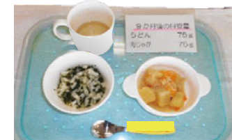
※試食ではなく、展示のみとなることがあります